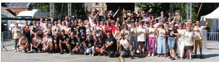
Une équipe de bénévoles soudée, ce qui se ressentait sur la fluidité et l'ambiance du week-end.