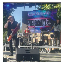
Le groupe « Cherokee » a ouvert la 2 ème soirée du Charoc. Il est venu avec ses admiratrices.