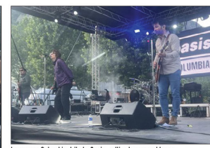
Le groupe Columbia, tribute Oasis, cultive la ressemblance tant vocale que physique avec les frères Gallagher.