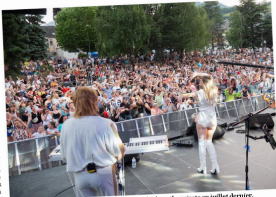
Si la place du Champ de foire était pleine d'une foule enthousiaste en juillet dernier, les organisateurs attendent au moins autant de monde en juin prochain